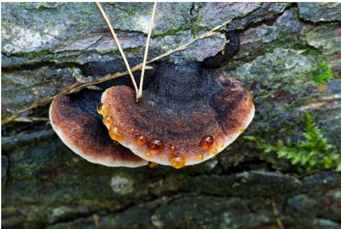
Teervlekkenzwam met guttatedruppels